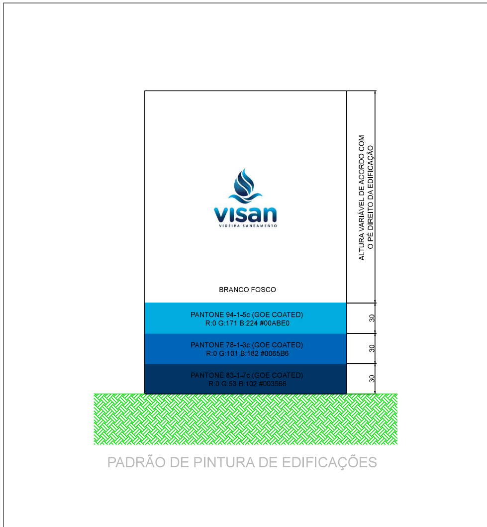
PADRÃO DE PINTURA DE EDIFICAÇÕES